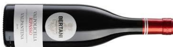
RIPASSO Valpolicella VALPANTENA 2020 BERTANI €28,00