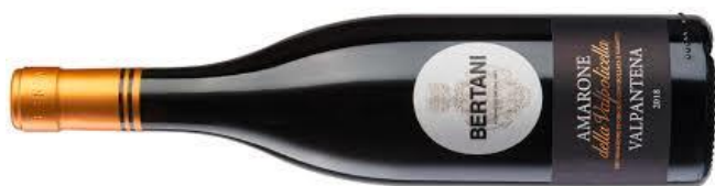
AMARONE della Valpolicella VALPANTENA 2020 BERTANI €65,00